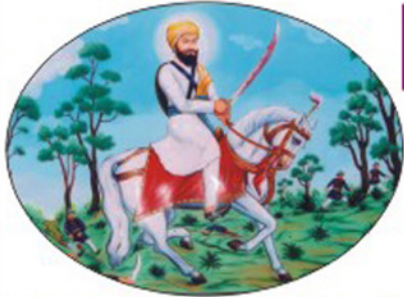
ਧੰਨ ਧੰਨ ਸ਼ਹੀਦ ਬਾਬਾ ਤੇਗਾ ਸਿੰਘ ਜੀ